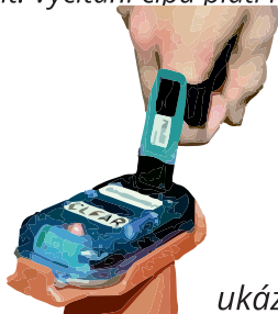
ukázka ražení SI jednotky

Použití: 1. V prostoru startu bude k dispozici testovací jednotka „check“, - kde si můžete vyzkoušet jak jednotka SI funguje. 2. Na startu se nic nerazí – čas se počítá od startovního výstřelu 3. Na obrátce (2,5 km a 5 km), se razí jednotka SI, která slouží jako důkaz průběhu a zároveň vám změří mezičas na průběhu. 4. V cíli se razí cílová jednotka, která ukončuje závod a měření. 5. Po doběhu nezapomeňte přijít zpět na prezentaci, kde si čip „vyčtete“, - zařadíte se do výsledkové listiny a zároveň obdržíte svůj výsledek ( i s mezičasem). Nezapomeňte půjčený čip na prezentaci vrátit! Vyčítání čipu platí i pro závodníky, kteří závod nedokončí.